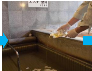
[C 剤で中和・リンス]